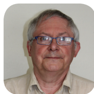
Dr F. Goret ORL ♥ photographie 071/26.54.37